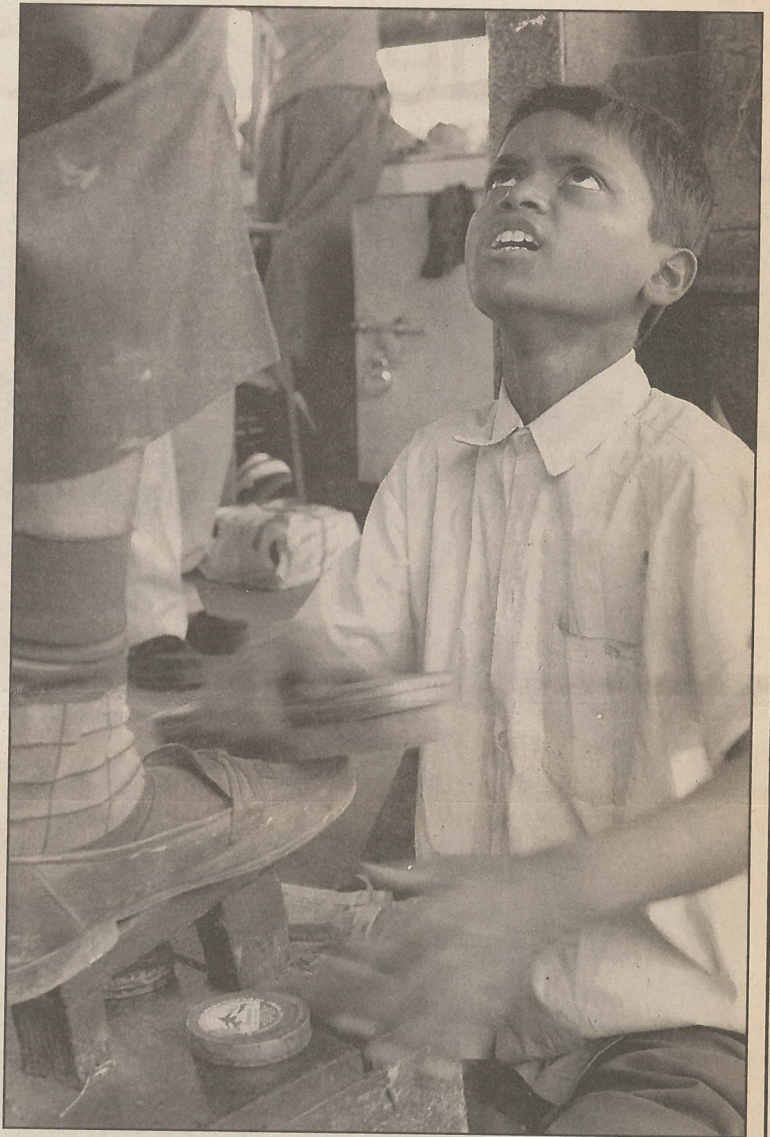
◆ Deze Indiase schoenpoetser is een van de honderden miljoenen kinderen die op veel te jonge leeftijd aan het werk worden gezet.

De gewenste bindende afspraken worden niet gekoppeld aan een boycot van landen die zich daaraan onttrekken.