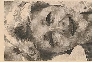
REDACTIE JOKE KORVING