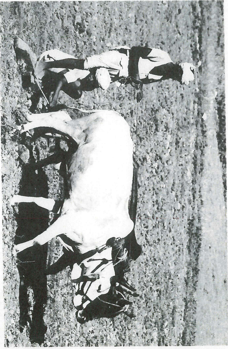
Landbouwers in India, wat extra gewicht om de grond aan te drukken.