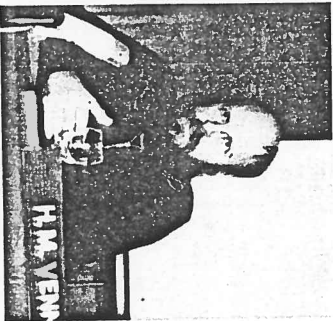
De directe oorzaken van de milieugrobelingen zijn van binnen en van buiten.

Jarenlang aageerden de Derde Wereld- en de milieubeweging tegen de EG- invoer van veevoer uit ontwikkelingslanden. En nu gaat de EG de invoer van veevoer inderdaad afbouwen. Lagere melkproductie, meer Europees graan in het veevoer en grotere zelfvoorziening in veevoergroeistoffen, zo luidt het Brusselse credo in de strijd tegen de landbouwerschokken. Een verhoogde ontwikkeling, zo lijkt het. Maar nee op het NIO- veevoersymposium op 11 december wilden de meeste sprekers de import vanuit ontwikkelingslanden juist omleren. Udo Sprang hoorde toe en konstateerde een overdosis realisme.