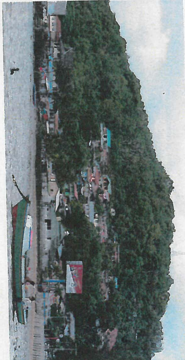
Umňkání ekosystém v deltě řeky Mahakam na východě Bornea je narušován těžbou ropy.